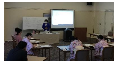
研修制度によりスキルアップ支援を推進