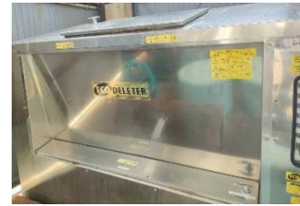
生ごみ処理機導入により、資源化に成功