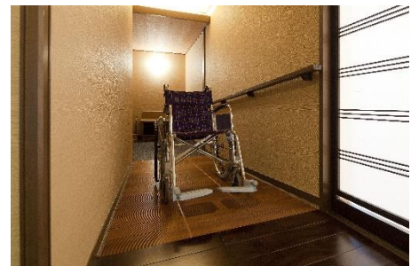
館内のバリアフリー環境の整備例