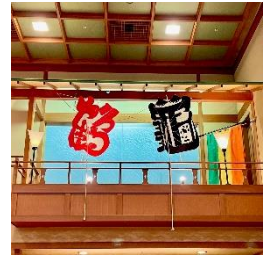
島根県ふるさと伝統工芸品「大社の祝風」